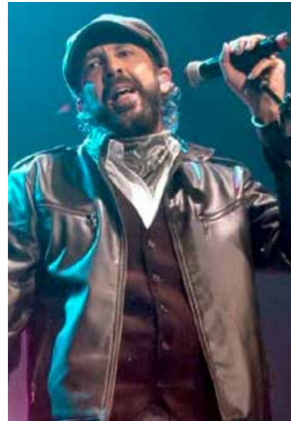
Juan Luis Guerra