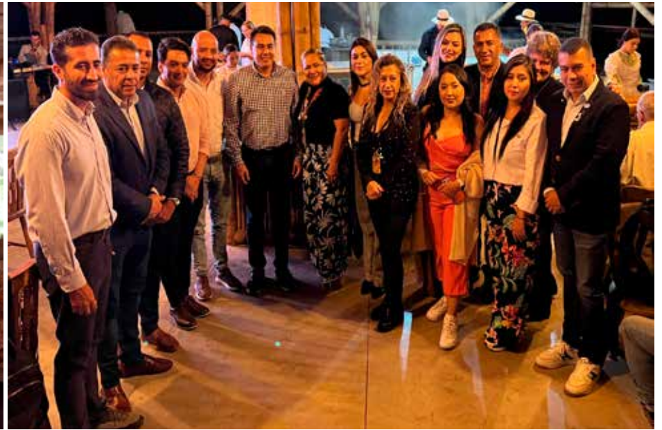
Autoridades locales e invitados especiales estuvieron presentes en la inauguración del trapiche panelero.