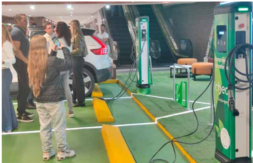
La nueva estación de recarga para vehículos eléctricos, scooters, patinetas y bicicletas prestará servicio gratuito hasta finalizar el año.

Ya son cuatro los puntos de carga de Chec en Manizales.