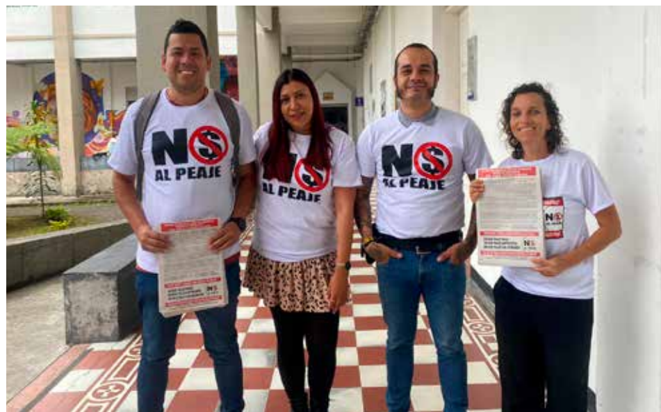
Integrantes de la Central Unitaria de Trabajadores, (CUT), seccional Caldas, durante la jornada de sensibilización con los habitantes del municipio de Chinchiná, sobre la necesidad de eliminar tres peajes en la Autopista del Café.

En opinión de la Presidenta de la Sociedad de Ingenieros Civiles a los caldenses les ha ido muy mal durante estos 27 años de concesión. "El proyecto ha tenido 28 cambios, con respecto al original, que se presentó a la Agencia Nacional de Infraestructura (ANI). Las modificaciones se hicieron para eludir la construcción de algunas obras, con el fin de incrementar las ganancias de la concesión".