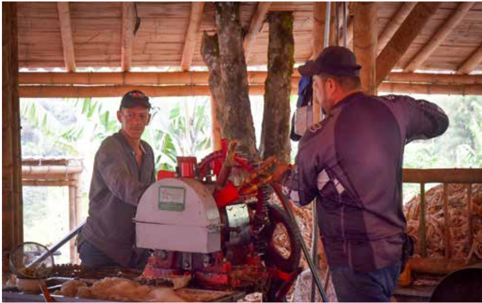
Molienda de caña en el trapiche panelero del restaurante Fogón de Palo, ubicado en el municipio de Neira, Caldas.