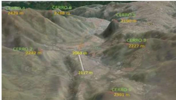
Figura 2. Obstáculos en cercanías al Aeropuerto La Nubia