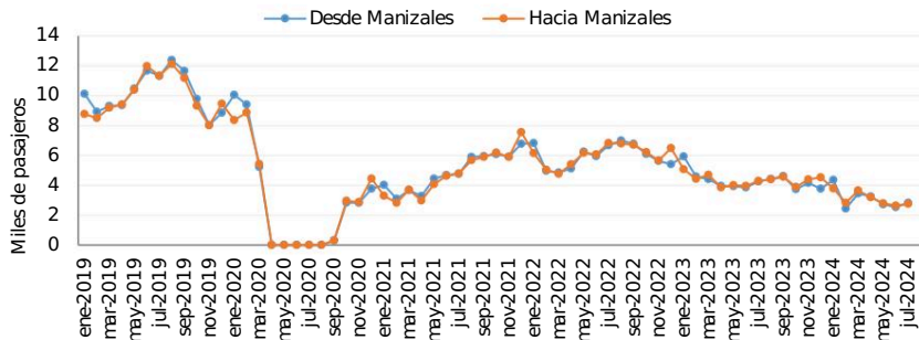
Gráfico 1. Movilización de pasajeros desde y hacia Manizales