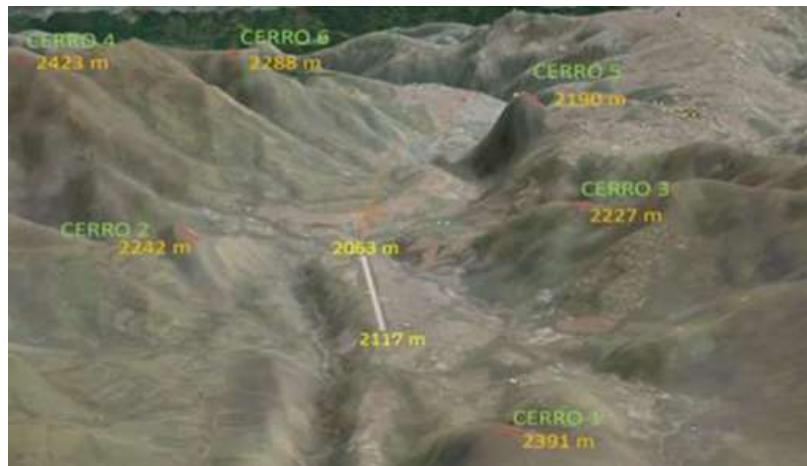
Figura 2. Obstáculos en cercanías al Aeropuerto La Nubia