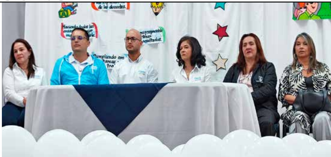
Representantes de las secretarías de educación de Caldas y Manizales acompañados de delegados de Confa, durante el lanzamiento del programa Pinta tu vida en la sede del Instituto Chipre de Manizales.

El programa lo lideran Confa y las secretarías de educación municipal y departamental.