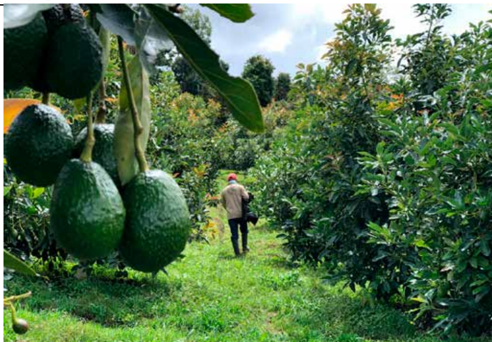
El aguacate Hass es la fruta más exportada en el país después del banano y el plátano.

El aguacate se convirtió en la tercera fruta más exportada en Colombia, después del banano y el plátano. En el 2023, las ventas al exterior llegaron a 120.000 toneladas. Corpohass proyecta que este año las exportaciones crecerán por lo menos un 15 %, lo que equivale a