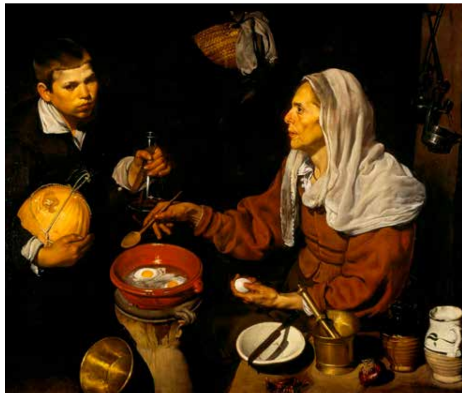
La vieja friendo huevos , uno de sus cuadros más populares del pintor español Velázquez.

Sobre este tema, el pintor hizo otra versión titulada Almuerzo de campesinos