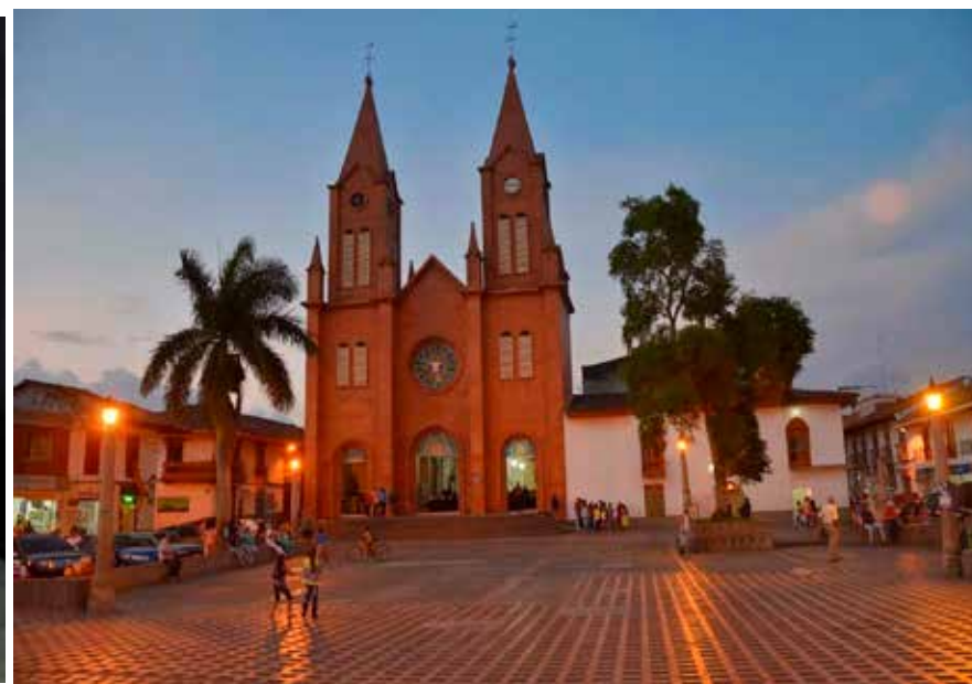
Atardecer en el Parque Jorge Robledo de Anserma.