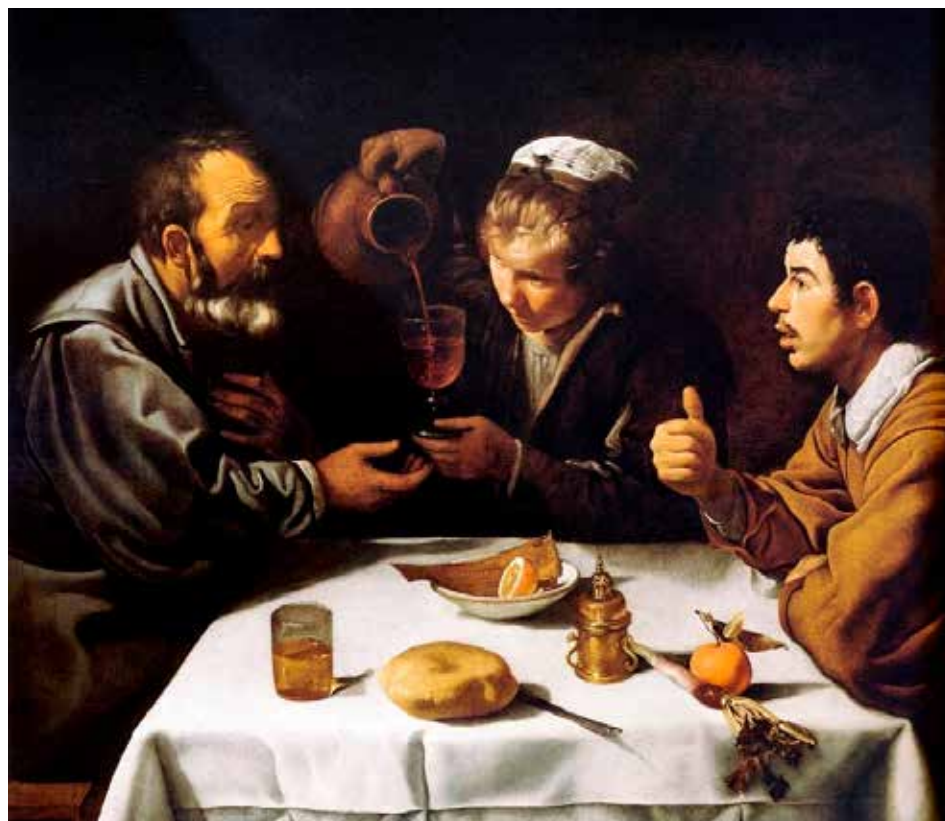
Muchacha y dos hombres a la mesa , del pintor sevillano Velásquez.