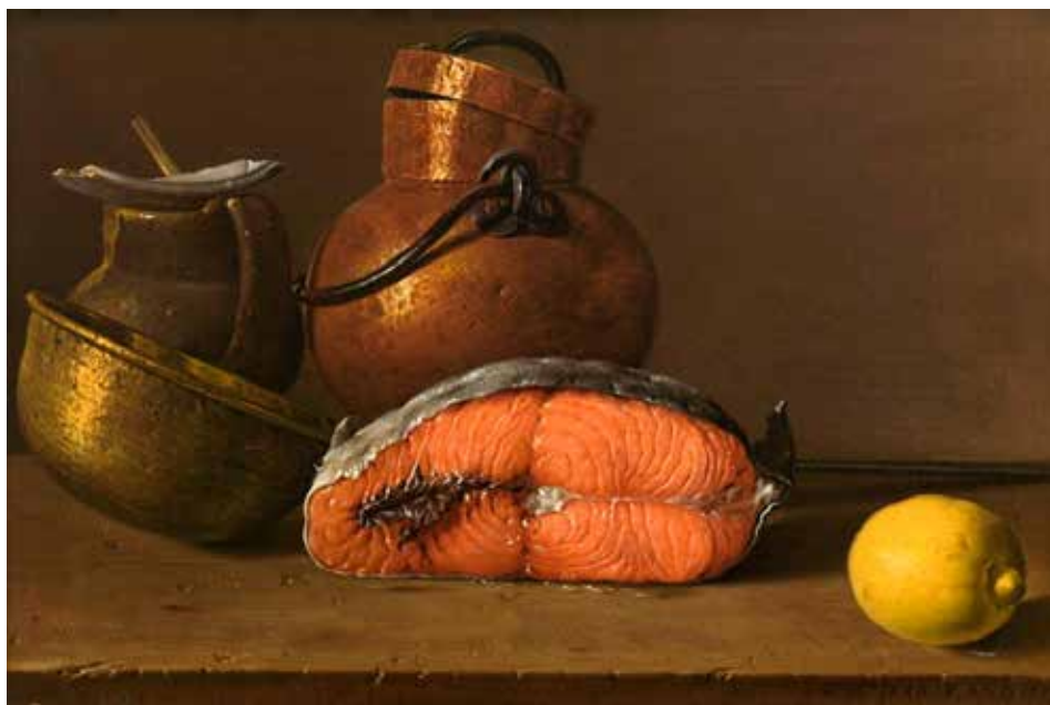
Bodegón con salmón, limón y recipientes , expuesto en el Museo del Prado. La perfección el arte de Luis Egidio Meléndez .

Aunque nació en Italia, Luis Egidio Meléndez era de familia española y desarrolló casi toda su obra en España. Este pintor es uno de los más destacados en el terreno de los bodegones o naturaleza muerta, especialmente