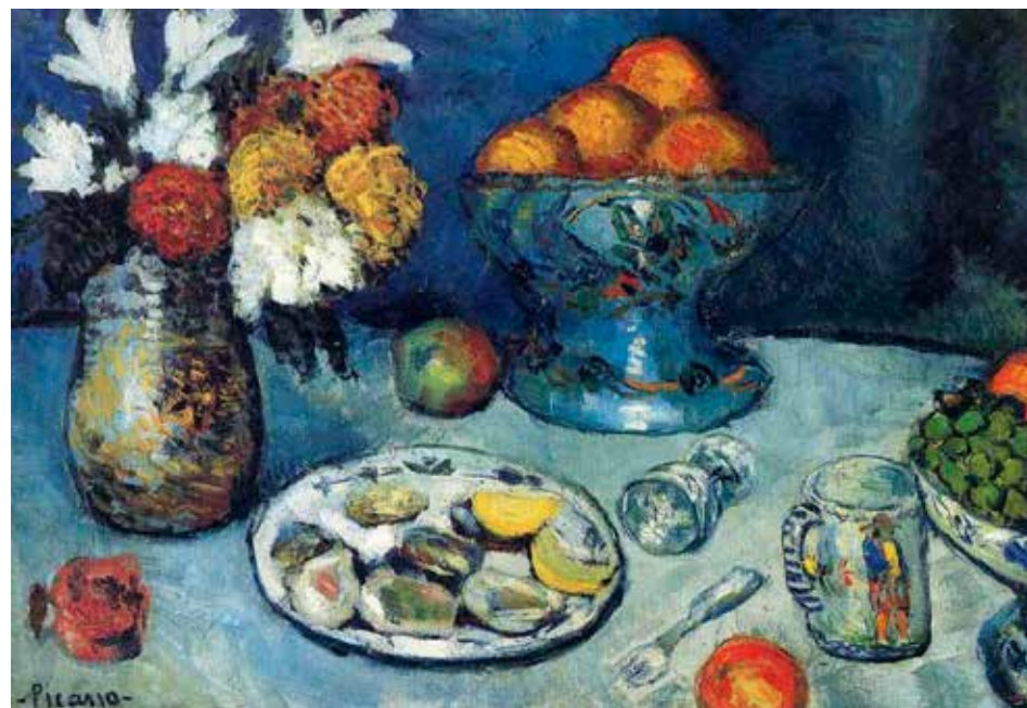
Naturaleza muerta (El postre) obra de Pablo Picasso.