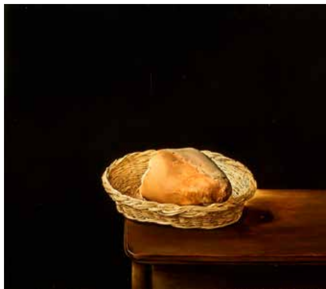
Con su obra La cesta de pan (1945), Salvador Dalí demostró su gran amor por la gastronomía.