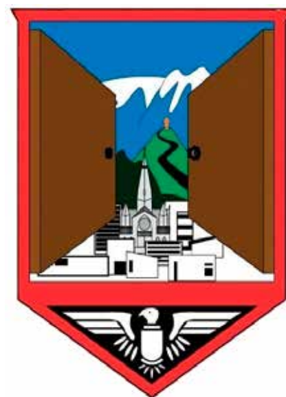
Escudo de Manizales