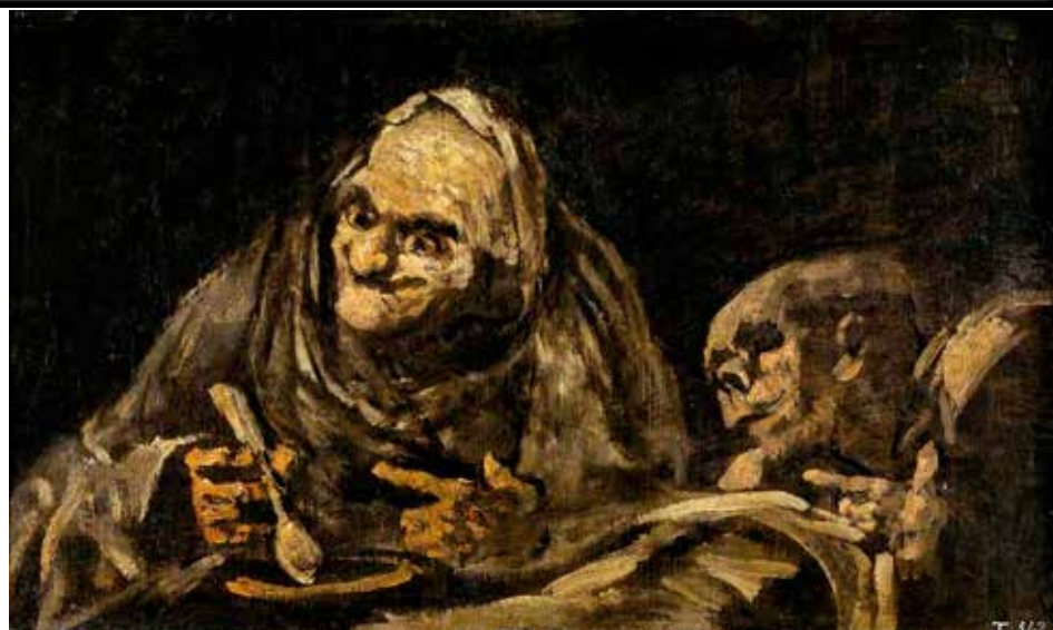
Dos viejos comiendo sopa , una obra que hace parte de las Pinturas negras de Goya.