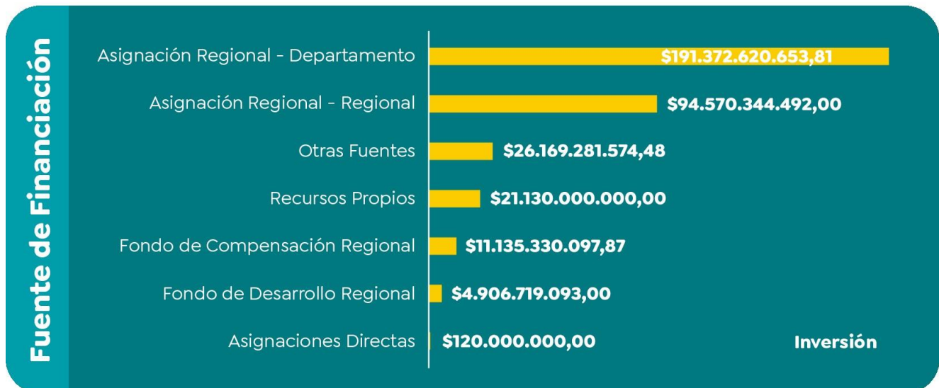
Gráfico 2: Fuentes de Financiación VALOR POR FUENTE de financiación